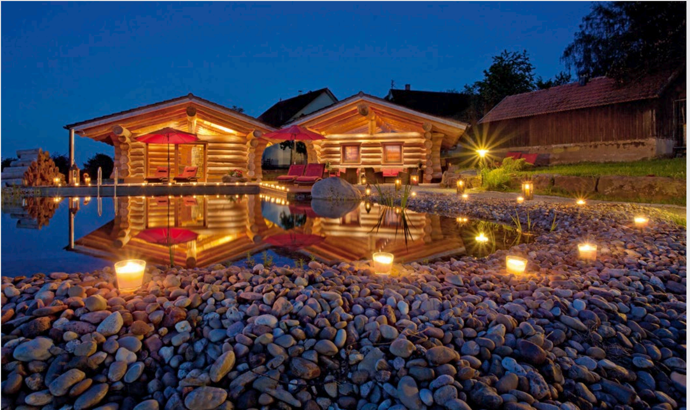
▲ Der Natur-Schwimmteich und die Sauna- und Massage-Blockhäuser werden mit Strom aus eigenen Wäldern versorgt

Das Hotel Konradshof in Seewald-Besenfeld hat zur Stromversorgung des Hotels eine eigene Holzgasanlage in Betrieb genommen. Das Holz dafür stammt hauptsächlich aus den eigenen Wäldern