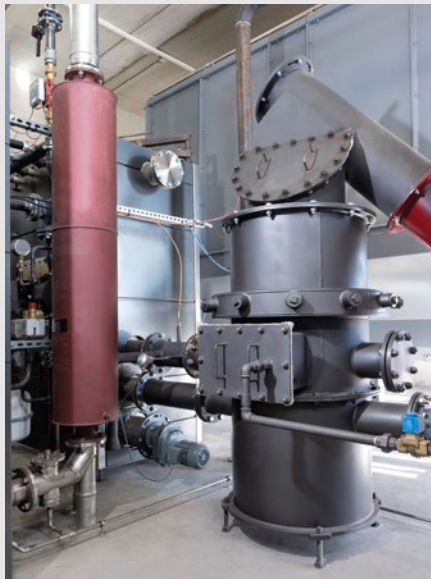
▲ 110 kW thermische und 65 kW elektrische Leistung